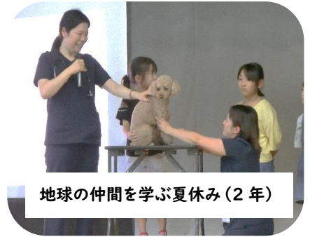
地球の仲間を学ぶ夏休み(2年)