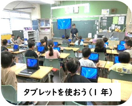
タブレットを使おう(1年)