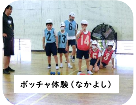
ボッチャ体験(なかよし)