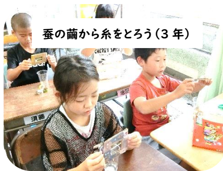
蚕の繭から糸をとろう(3年)