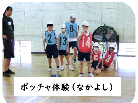
ボッチャ体験(なかよし)