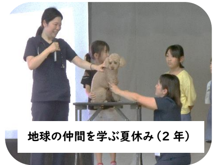
地球の仲間を学ぶ夏休み(2年)