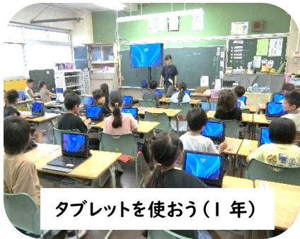
タブレットを使おう(1年)